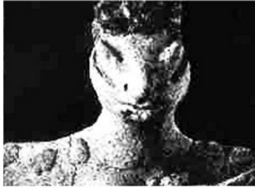
Statuette sumérienne de reptilien