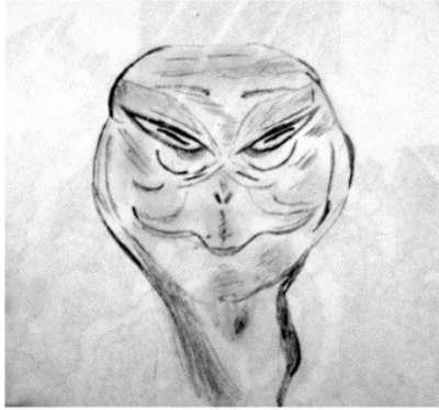
Apparence de Rokula

masque de bienfaiteur/guérisseur/prêcheur/ etc.