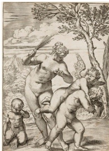
« Vénus punit Éros » (Agostino Carracci)